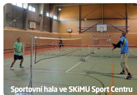
Sportovní hala ve SKiMU Sport Centru