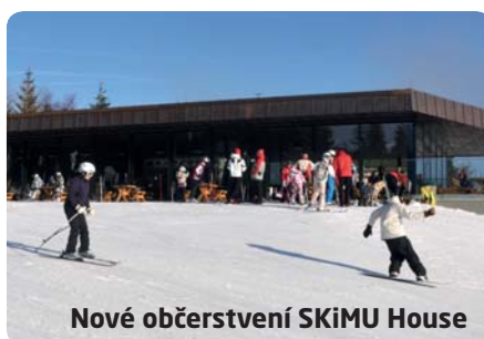
Nové občerstvení SKiMU House